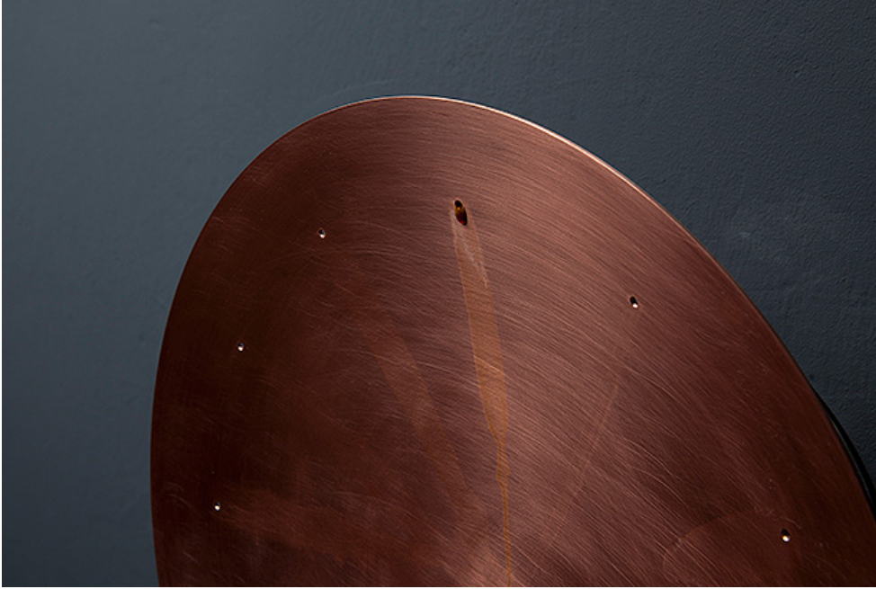
Настенные часы Es liegt was in der Luft. Дизайнер Patrick Palcis. Германия.